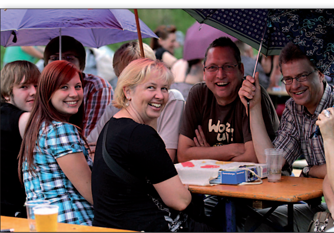
Trotz Regen gute Stimmung: Die Zuschauer hatten ihren Spaß beim Programm der Tattoo-Party.